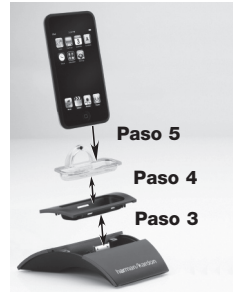
Figura 3. Colocando un iPod en la unidad The Bridge II

NOTA: No coloque el iPod en el sistema The Bridge II si los adaptadores correspondientes no están colocados. Si lo hiciera, el iPod no se conectaría correctamente y ambos dispositivos –iPod y The Bridge II – podrían sufrir daños no cubiertos por la garantía.